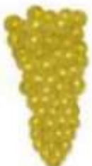
Chiusura / invaiatura